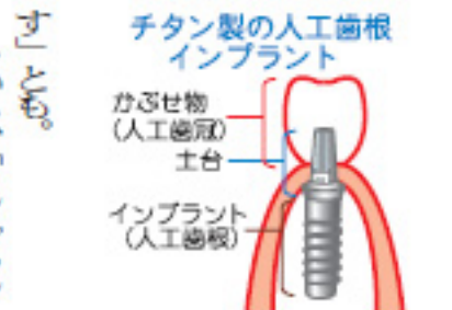
チタン製の人工歯根 インプラント